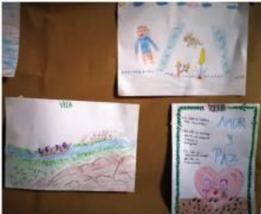
Dibujos alusivos a la vida

Fue uno de los primeros talleres que evocó las alternativas de solución, desarrolladas por la comunidad, respecto al suicidio. En cuanto a la estructura: No se hicieron preguntas orientadoras, fue una actividad espontánea, el objetivo era centrarse en las acciones que se debía hacer a nivel comunitario para resolver los problemas desde la comunidad, la idea era llegar a compromisos como plan de acción comunitario. recuerdos, cuando se pregunta directamente por casos de suicidio, se permite un espacio para la expresión emocional, por medio de diferentes saberes prácticos artísticos.