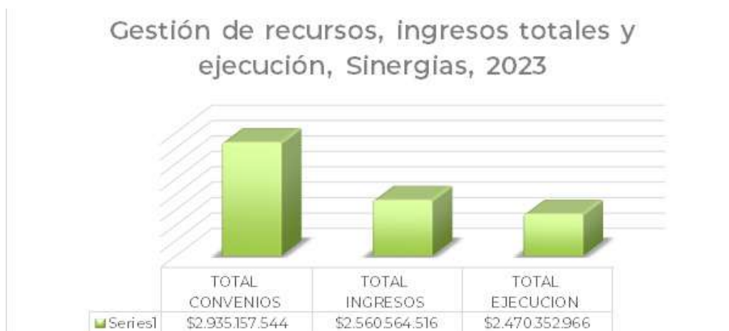
Grafica Nro. 2 Gestión de recursos, ingresos totales de la vigencia y ejecución

Los ingresos recibidos por conceptos de ejecución de convenios y proyectos con los diferentes financiadores ascienden a los $2.560.564.517 pesos colombianos. Los recursos ejecutados en 2023 fueron $2.269.588.649 pesos colombianos , lo que corresponde a un porcentaje de ejecución de 96%.