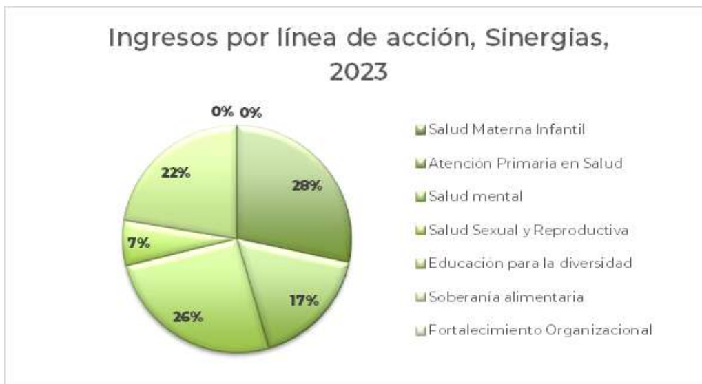
Gráfica Nro. 3. Porcentaje de ingresos de Sinergias por línea de acción para el año 2023