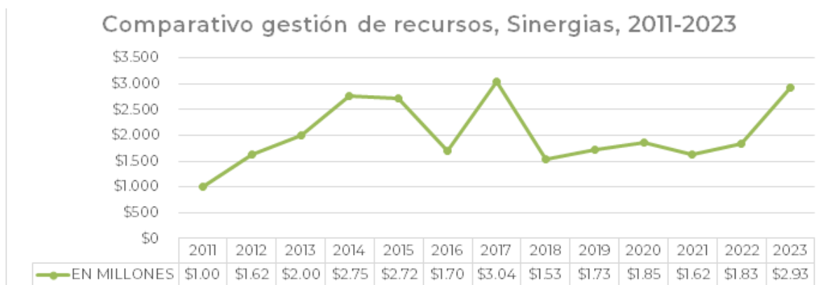
Grafica Nro. 1 Comparativo de Gestión de Recursos